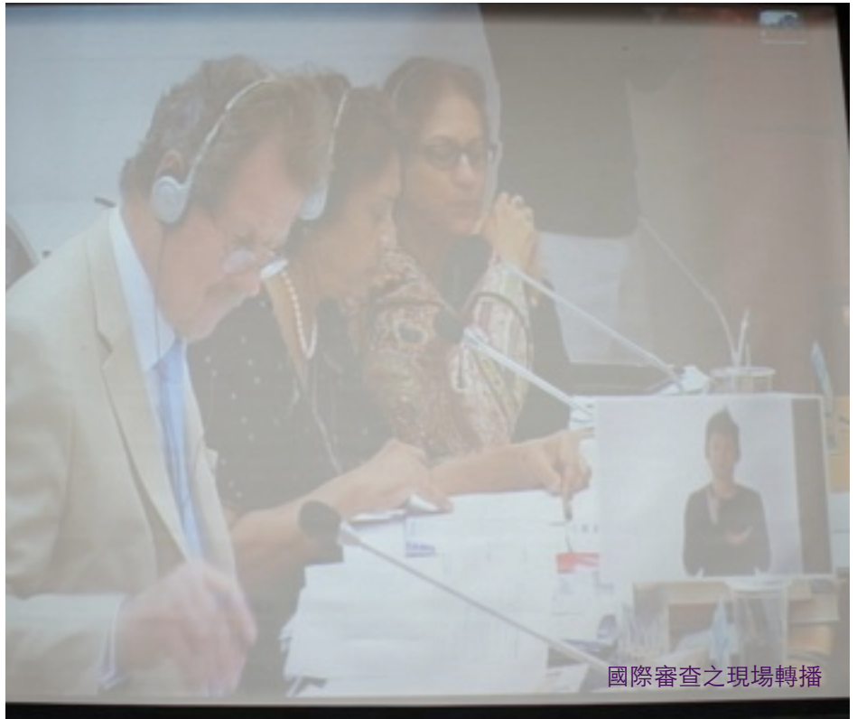
國際審查之現場轉播